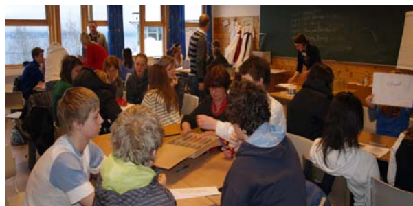
Ungdomssteget ved Sagatun "tjuvstarta" med entreprenørskapsaktivitetar dagen før messa. På sjølve messedagen fekk alle elevane vere med på to av fagseminara: entreprenørskap, etablering av eiga bedrift, ungdom og økonomi, kreativitet og design, marknadsføring og internasjonalisering.