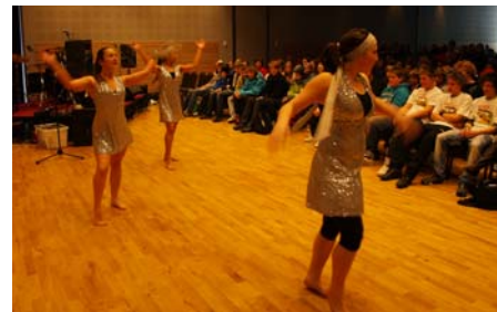
Jentene frå Dans utan grenser var ikkje mindre dyktige!