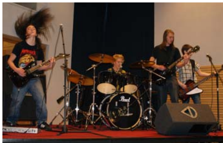
C4 frå Høyanger leverte ein flott minikonsert under opninga.